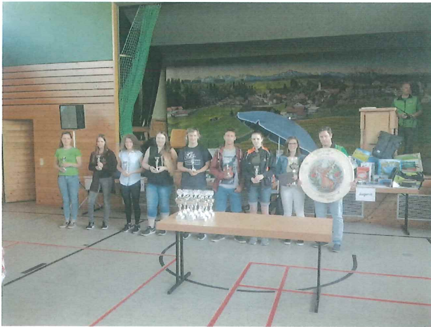
SCHÜTZENJUGEND IM SPORTSCHÜTZENGAW KAUFBEUREN-MARKTOBERDORF